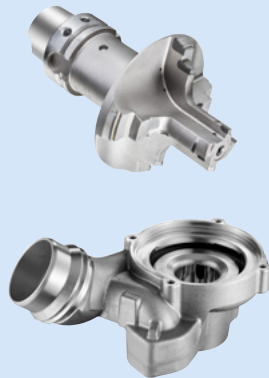
validation de géométrie d'outils & conditions de coupe